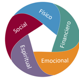
5 dimensiones del bienestar

No tendrá que pagar más por la mayoría de estos programas; de hecho, ¡puedes obtener incentivos por muchas de las actividades!